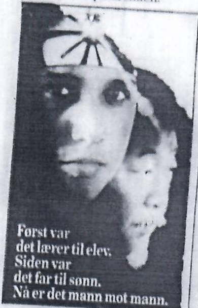
Forst var det lærer til elev. Siden var det far til sønn. Nå er det mann mot mann.

«Karate Kid III» med aldersgrense 10 år står på spilleplanen for Arnes kino onsdag. Rekker du ikke den forestillingen, gis ny sjanse søndag. Filmen handler om karatelæreren og hans elev. Tradisjonen tro må mesteren forsvare sin tittel, og den unge mester stilles på vanskelige prøver, også fordi skumle personer kommer inn på arenaen.